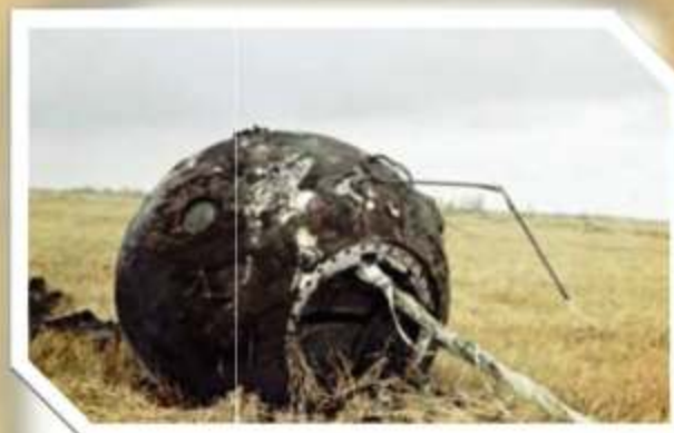
Капсула после приземления.