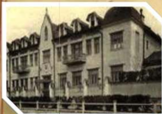
Здание Саратовского аэроклуба.